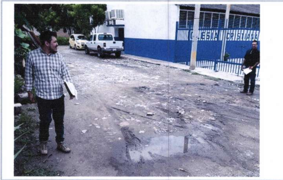
LIMPIEZA Y TRAZO EN EL AREA DE TRABAJO.

No. de CONTRATO: IGUALA/SDUOP/FISMDF/URB/2019-11