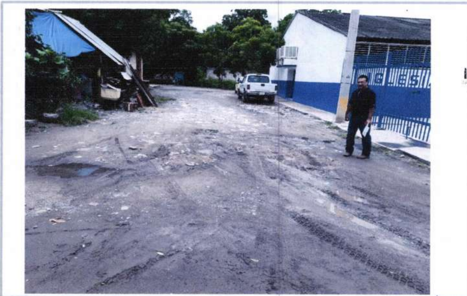
LIMPIEZA Y TRAZO EN EL AREA DE TRABAJO.