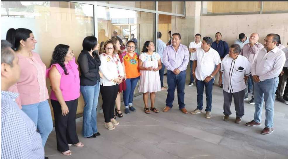
15/09/2023 ASISTENCIA AL GRITO DE INDEPENDENCIA.